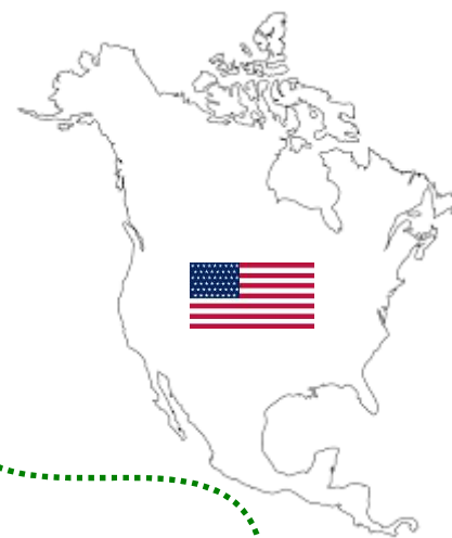
Total US fintech investment activity (VC, PE and M&A) in fintech companies 2010 – Q3'17